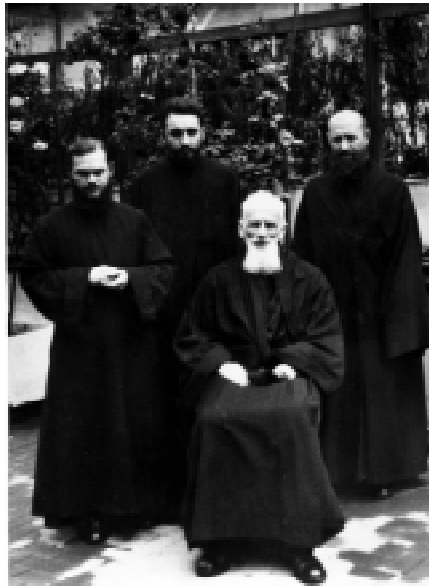
О.-архімандрит Климентій Шептицький і ченці-студити (30-ті роки XX ст.)

У 1941 р. Слуга Божий Митрополит Андрей та його брат Блаженний Архімандрит Унівської Лаври Климентій Шептицький, спонукувані Господньою заповіддю любові до ближнього, започаткували та керували потужною акцією, спрямованою на врятування невинно переслідуваних фашистською владою євреїв. Завдяки їх діяльності врятовано сотні євреїв від жорстоких тортур та лютої смерті. У греко-католицьких монастирях переховували ба-