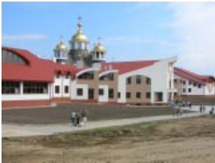
Львівська Духовна Семінарія (загальний вигляд)

27-28 серпня у Львові по вул. Хуторівка відбулося посвячення комплексу Львівської Духовної Семінарії та будинку Філософсько-Богословського Факультету УКУ в новому Богословському Центрі. У події взяв участь Блаженніший Любомир Гузар, та члени Синоду єпископів УГКЦ.