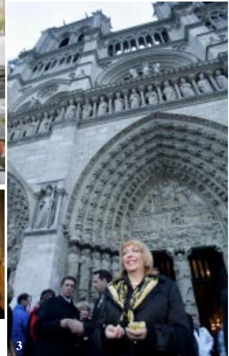
1 — На кладовищі Монпарнас біля могили Симона Петлюри 2, 3 — під час і після Літургії в Соборі Паризької Богоматері